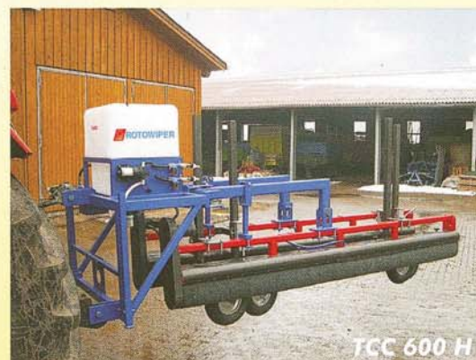
TCC 600 H

TCC 600 HD: Mit Zapfwelle und separatem Hydraulikantrieb für die Walzen.