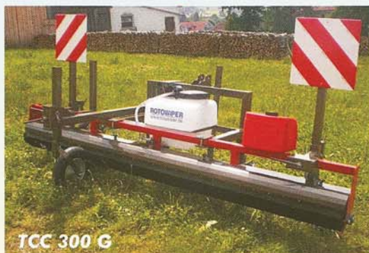
TCC 300 G

Vieleisig einsetzbar: im Frontanbau mit selektiven Herbiziden und im Heckanbau mit Totalherbiziden.