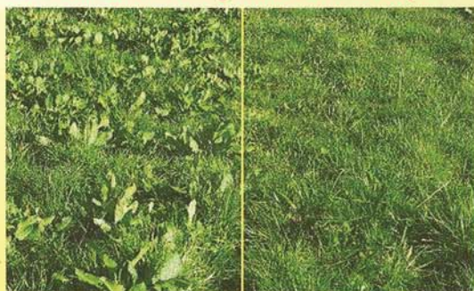
Aufwuchs auf unbehauelter Fläche.